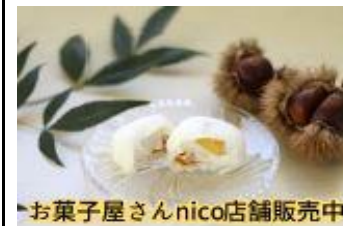
お菓子屋さんnico店舗販売中

このほかにも、おらだり基地倉庫アートや、地産地消キッシュ、ゴミ拾いゲーム、オンラインツアー、荒川写真集、ラベンダーグッズ、フードドライブ事業、荒川マンガ、荒川カレンダー、空き家活用イベントなど、たくさんのチャレンジ企