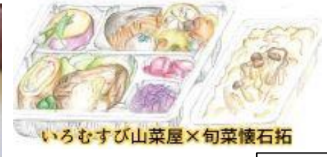
いろむすび山菜屋×旬菜懐石拓