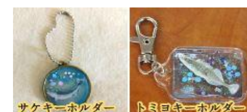
サケキーホルダー トミヨキーホルダー