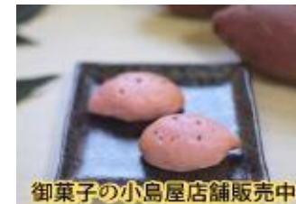
御菓子の小島屋店舗販売中