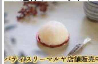
パティスリーマルヤ店舗販売中

8月の商工会報にてご案内した、荒川中学校3年生×あらかわ地区まちづくり協議会×荒川商工会の企画『荒川チャレンジ』。「持続可能な地域づくり」や「社会課題解決」のために中学3年生が考えた企画のプレゼン発表後、当会会員企業を含めたくさんの協力をいただき、チャレンジ事業が進行しています!